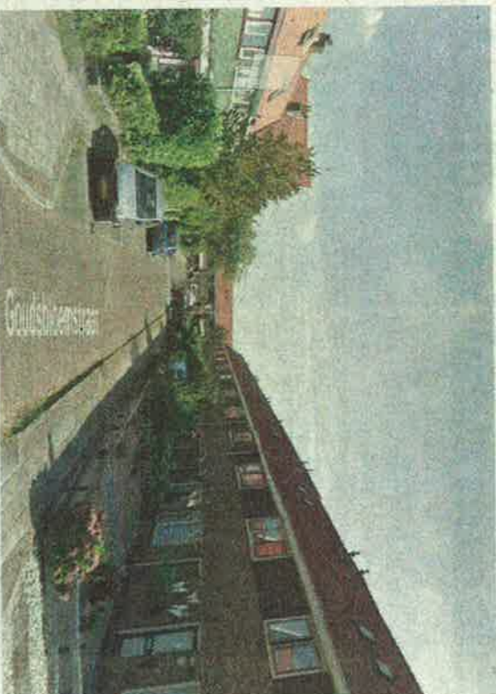
▲ De Goudbloemstraat, toneel van een burenruzie.